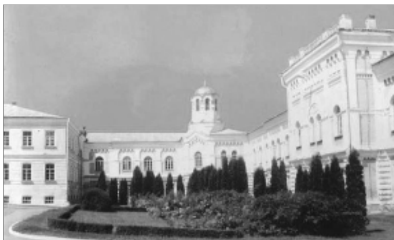
Так выглядит Уманский аграрный университет в начале XXI века.