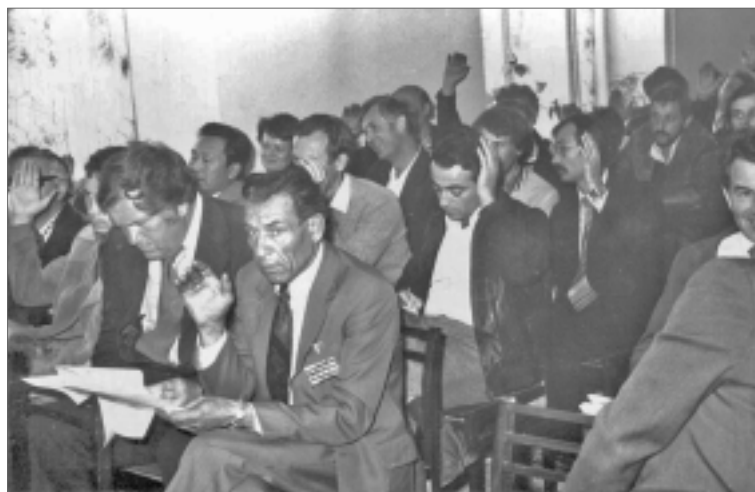
Начало восьмидесятых годов – партийное собрание.