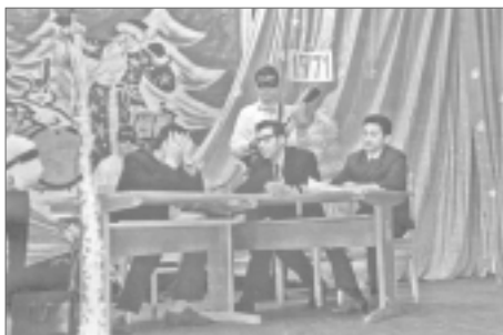
Добрый и злой экзаменаторы.