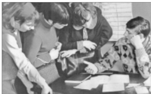
Ленинград, ЛЭТИ, шестидесятые