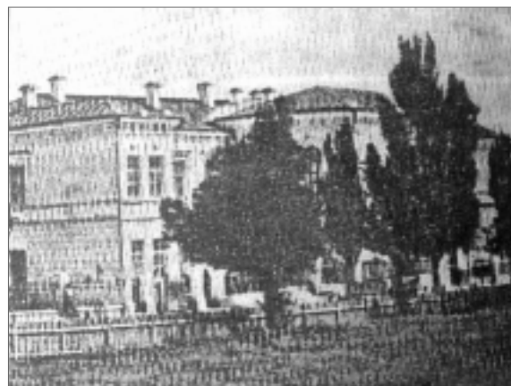
Дореволюционная Умань. Здание мужской гимназии. В советские время – техникум механизации.