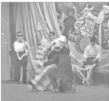
Драма Шиллера «Разбойники» – из-за болезни отца Моора ее отменили.