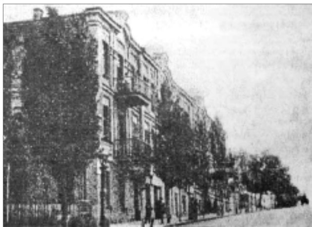
Дореволюционная Умань. Садовая улица. В советское время – улица Карла Маркса.