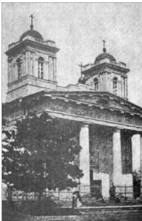
Дореволюционная Умань. Польский костел.