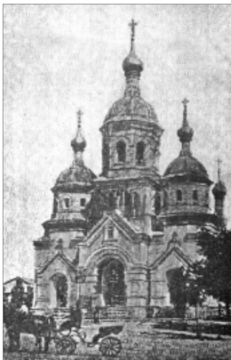
Дореволюционная Умань. Военный православный собор. В советское время в нем был устроен кинотеатр имени Черняховского.