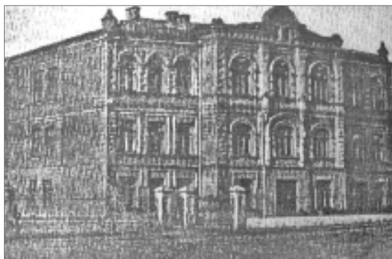
Дореволюционная Умань. Здание женской гимназии. Ныне в нем – школа № 2.