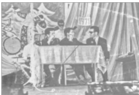
Студент-«рецидивист» рубит очередной «хвост». Ботаем по фене.

Эта песня прозвучала в офицерском клубе на берегу Аральского моря в исполнении вчерашних студентов, на два года ставших лейтенантами. В новогоднем представлении «Бывали дни веселые» мы, веселясь и ностальгируя, языком капустника растолковали кадровой военной аудитории ответственную и развеселую суть студенческой жизни.