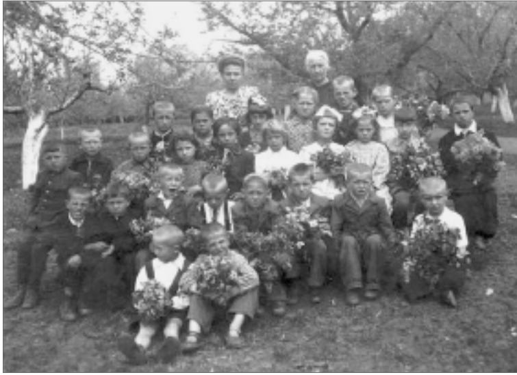
Май 1954 года. Торжественный снимок первого класса Уманской средней школы номер девять. Я – в первом ряду, в фирменных, мамино пошива, шортиках на бретельках.