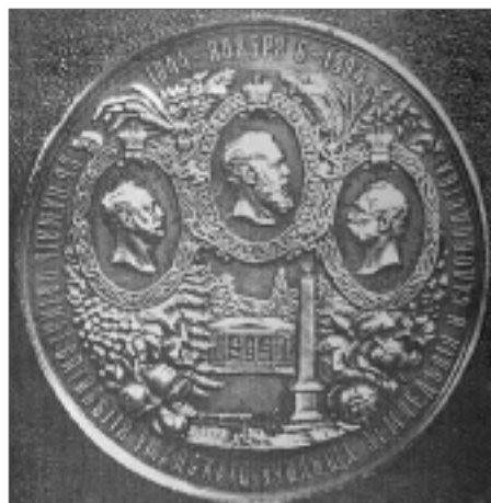
Памятная медаль в честь пятидесятилетия Уманского училища земледелия и садоводства (аверс и реверс).