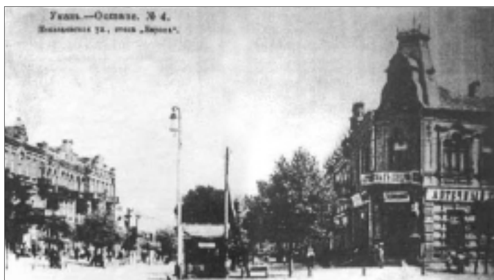
Дореволюционная Умань. Николаевская улица, справа – отель «Европа».