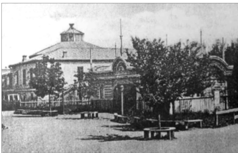
Дореволюционная Умань. Здание городского театра. Ныне на его месте – Дом культуры.

Снимки взяты из книги С. В. Нечаева «Старая Умань», Умань, 1996.