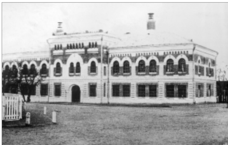
Так во второй половине XIX века выглядел корпус Главного училища садоводства, переведенного указом Николая I в 1849 году из Одессы в Умань.