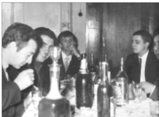
Ленинград, ЛЭТИ, шестидесятые. Общежитие на Муринском проспекте.