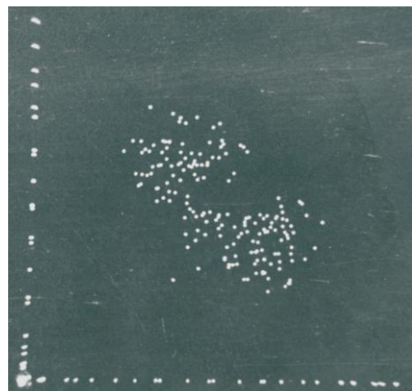
Двумерное распределение осколков деления ядер ^{238}\text{U} под воздействием пучка ионов ^4\text{He} (на экране монитора ОК-17). Координаты точек соответствуют энергиям осколков. Измерения 1963 г.