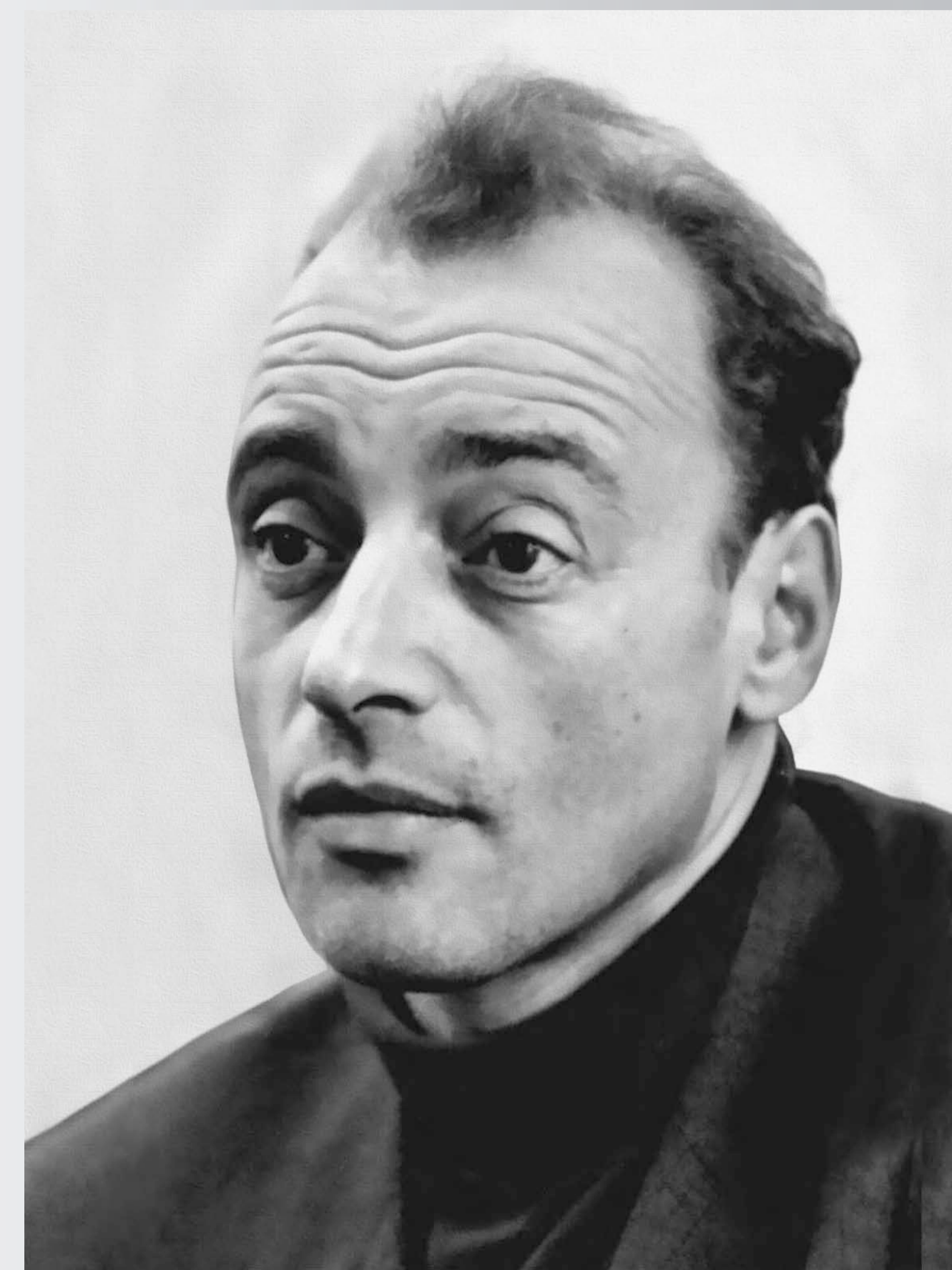
ГРИБОВ Владимир Наумович 25.03.1930 – 13.08.1997

Член-корреспондент АН СССР (1979). Первый директор Ленинградского института ядерной физики им. Б. П. Константинова АН СССР (1971–1985). Заведующий Лабораторией нейтронных исследований (в настоящее время – Отделение нейтронных исследований), 1976–1981. Лауреат академической премии им. Б. П. Константинова (1985). Награжден орденами «Знак Почета» (1971), Трудового Красного Знамени (1975), Октябрьской Революции (1980).